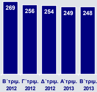
Οργανικά Κέρδη προ Προβλέψεων (€εκ.)