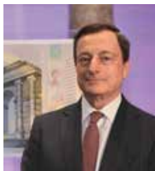
Mario Draghi Πρόεδρος της Ευρωπαϊκής Κεντρικής Τράπεζας

Από τη στιγμή που τέθηκαν σε κυκλοφορία το 2002, τα τραπεζογραμμάτια ευρώ κέρδισαν την εμπιστοσύνη του κοινού σε παγκόσμιο επίπεδο κι έγιναν ένα από τα πιο αξιόπιστα μέσα πληρωμής. Για να διασφαλιστεί ότι η εμπιστοσύνη αυτή θα παραμείνει αμετάβλητη, στη σειρά «Ευρώπη» έχουν ενσωματωθεί οι πιο πρόσφατες τεχνολογικές εξελίξεις στον τομέα της παραγωγής τραπεζογραμματίων.